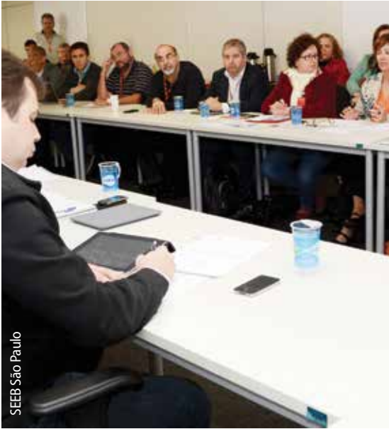
SEEB São Paulo