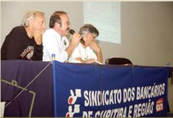
25.09 e 28.09 - Assembleias estão sendo realizadas para informar a categoria sobre a adesão ao movimento grevista e a Campanha Salarial 2009