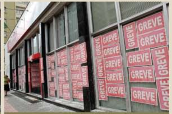
25.09 - Adesão aumenta no segundo dia de greve com 191 agências e manutenção dos centros administrativos sem expediente

Os bancários de Curitiba e região estão em greve desde o dia 24 de setembro. Confira o que já aconteceu e venha participar conosco!