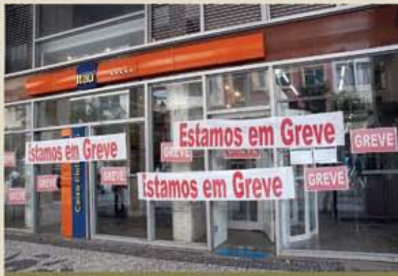
24.09 - Já no primeiro dia de greve, 144 agências e dez centros administrativos ficam fechados em Curitiba e região