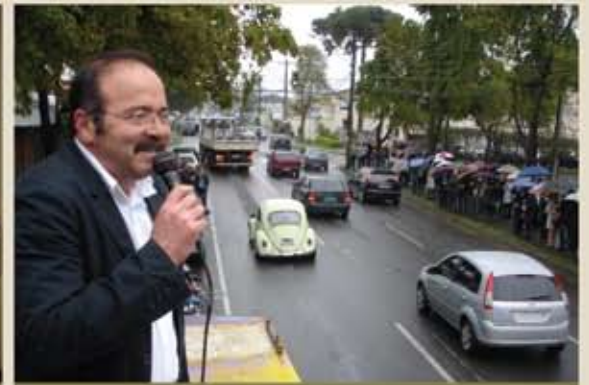
29.09 - Assembleias realizadas simultaneamente diante das três sedes administrativas do HSBC (Hauer, Xaxim e Kennedy)