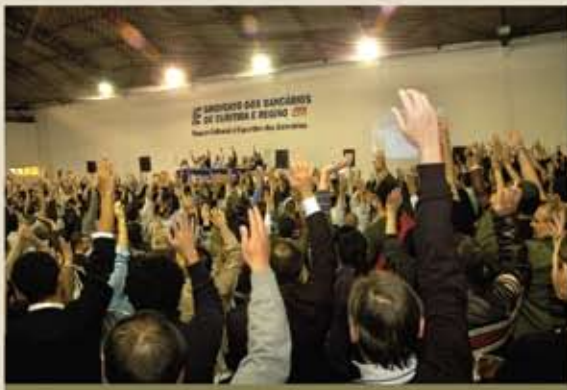
23.09 - Assembleia com mais de mil bancários deflagra greve por tempo indeterminado